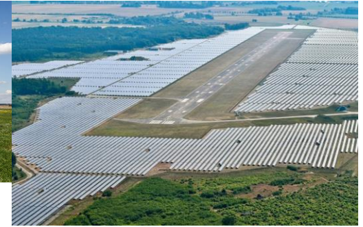
Bsp. Flugplatz Neuhardenberg