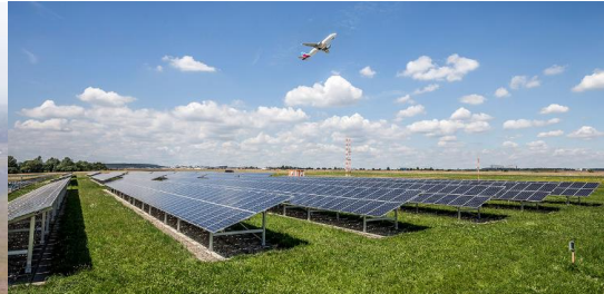
Bsp. Flughafen Stuttgart