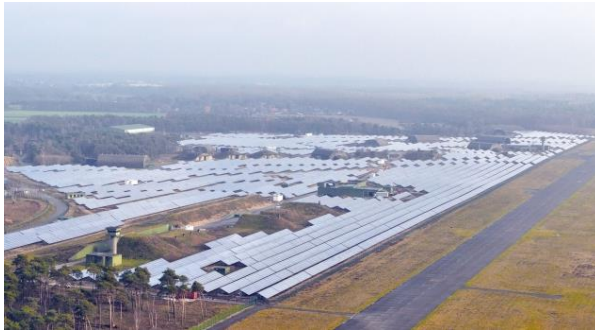
Bsp. Flughafen Weeze