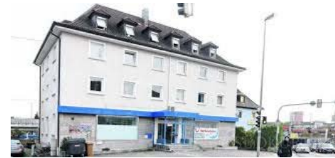
Friedrichshafen, Ailinger Str. 10