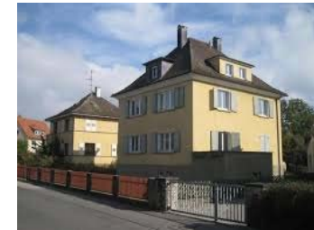
Langenargen, Untere Seestr. 98